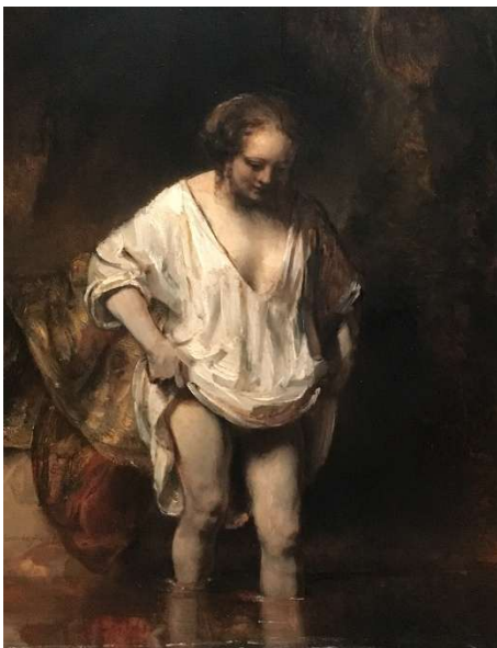
Rembrandt: „Hendrickje“, 1654